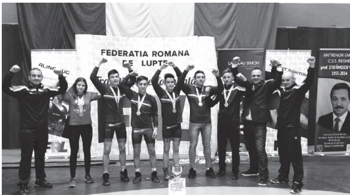
A helyi tehetséges birkózók egy csoportja