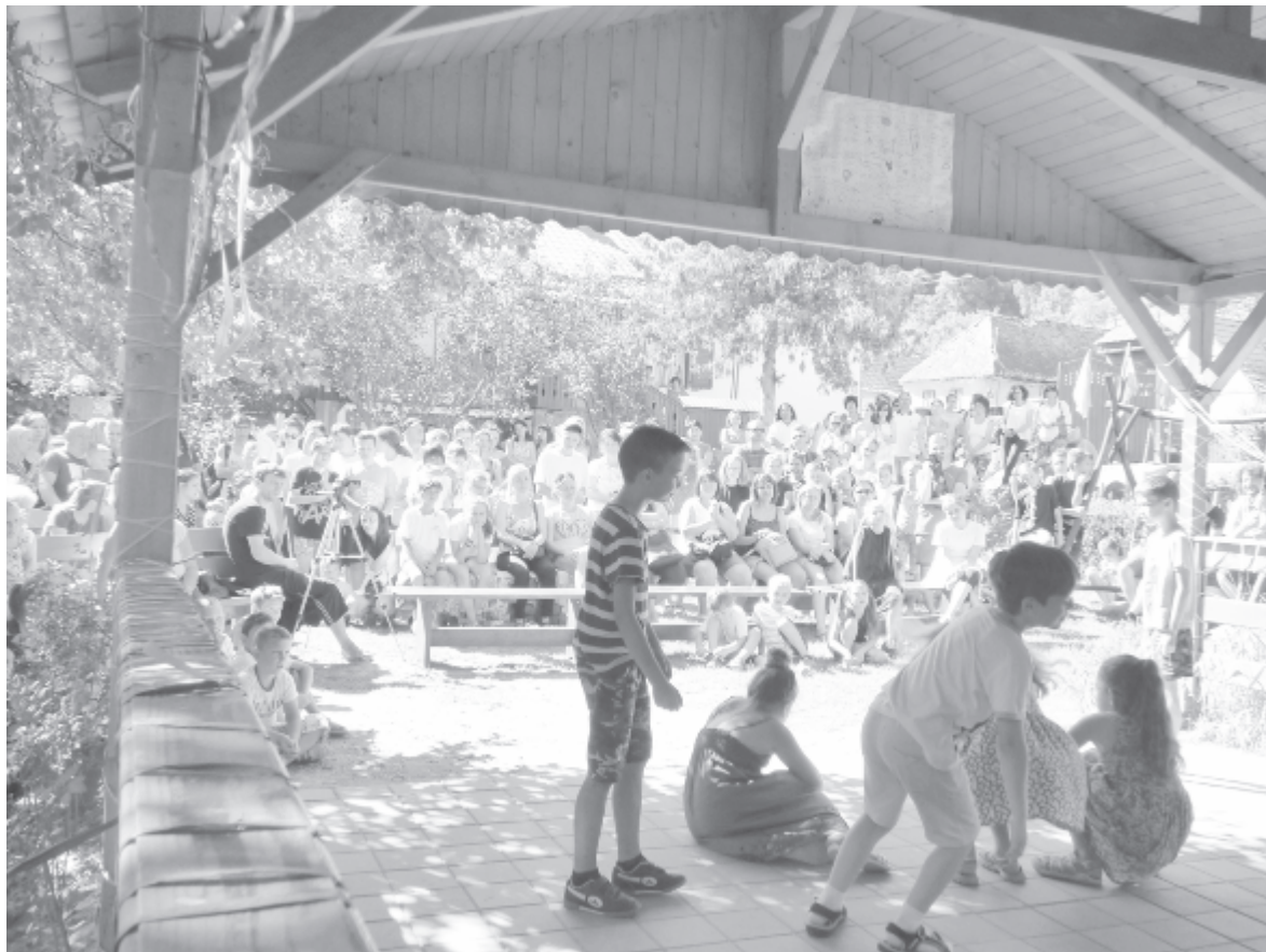
Sokszínű előadások tanúskodtak szombaton a heti munka eredményéről