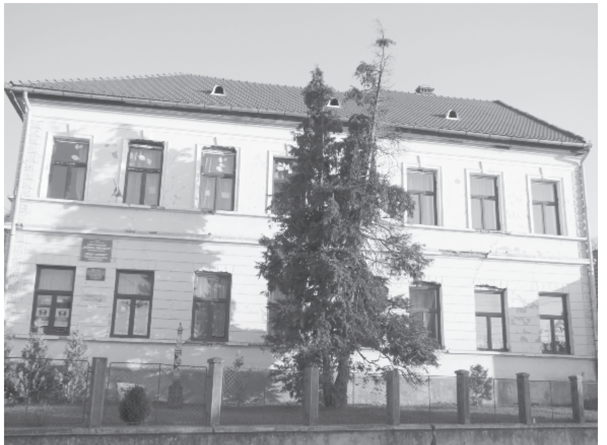
A jelenlegi épület felújítása és bővítése a tanteremhiány megoldása érdekében halaszthatatlanná vált

Structuri céggel 4.618.219,83 lej értékben, míg a teljes beruházás értéke 5.173.460 lej, ebből 4.853.267 lejt a minisztérium biztosítja a Helyi fejlesztések országos programja révén (PNDL), a 320.193 lej különbözetet Erdőszentgyörgy önrészként fizeti, az összeget elkülönítették az idei költségvetésben.